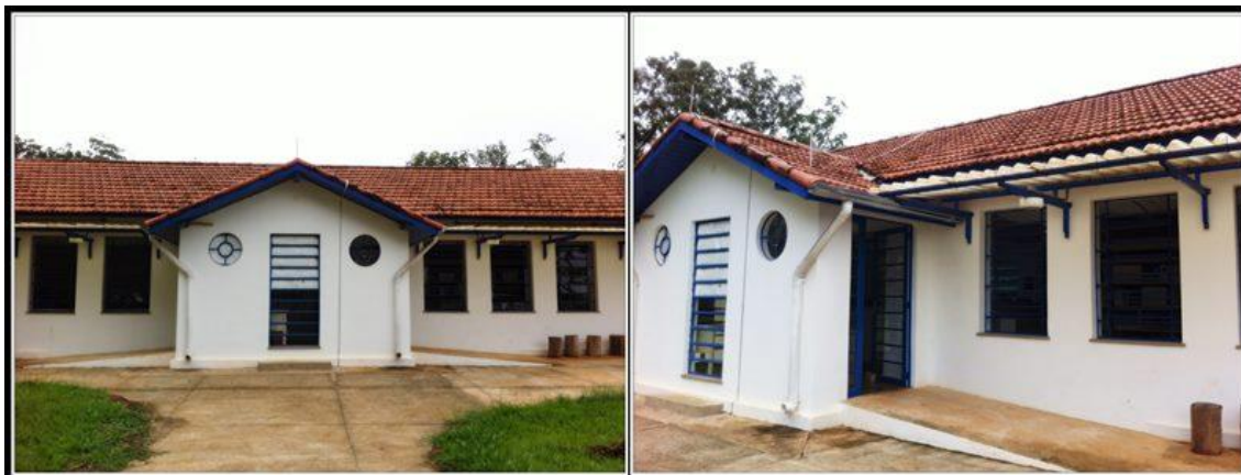
Figura 1 – Entrada da Biblioteca Campus Lagoa do Sino

abrigando uma sala para o acervo de livros, uma sala de estudos e uma sala de área de trabalho. Segue abaixo as fotos da entrada da biblioteca, do acervo e da sala de estudos.