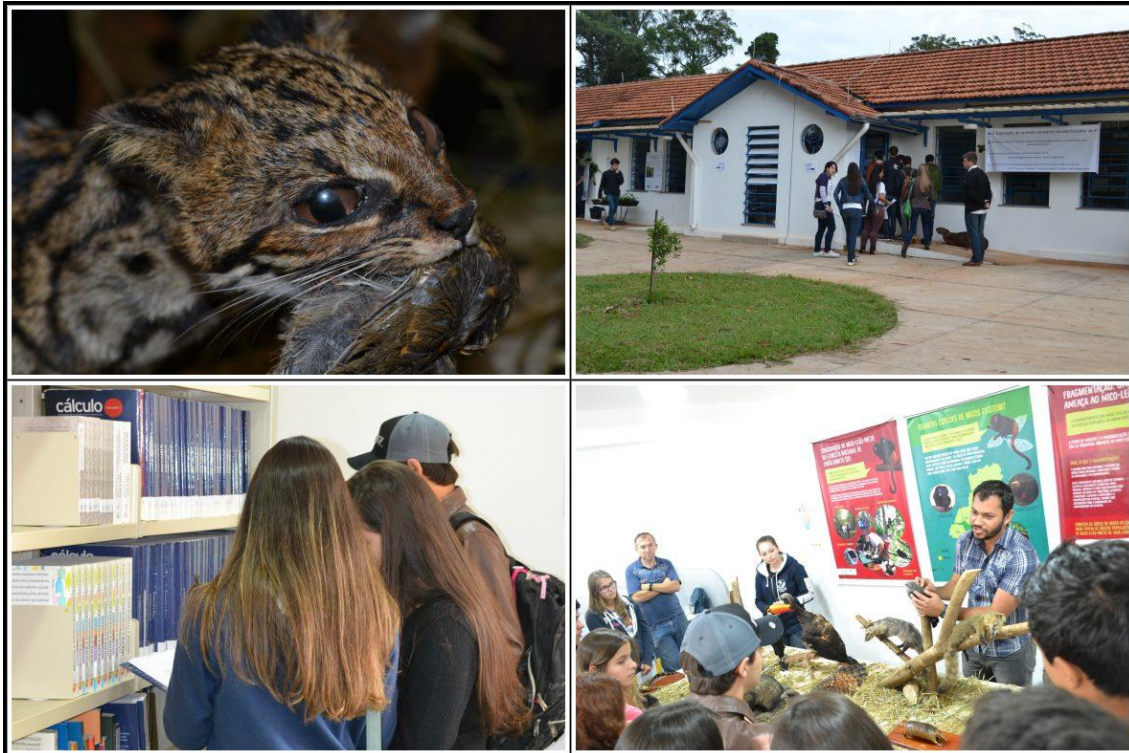
Figura 3: Exposição na Biblioteca Campus Lagoa do Sino.