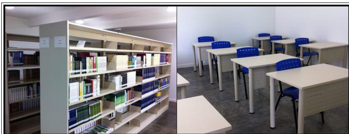
Figura 2 – Acervo e Sala de estudos da Biblioteca Campus Lagoa do Sino