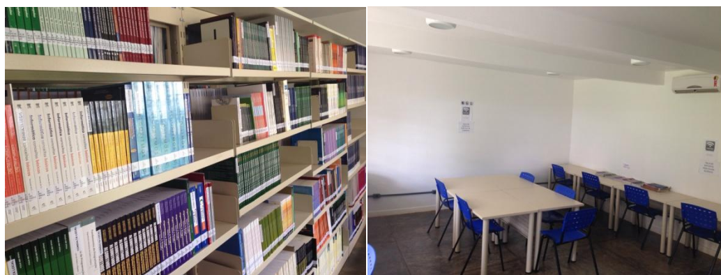
Figura 2 – Acervo e Sala de estudos da Biblioteca Campus Lagoa do Sino