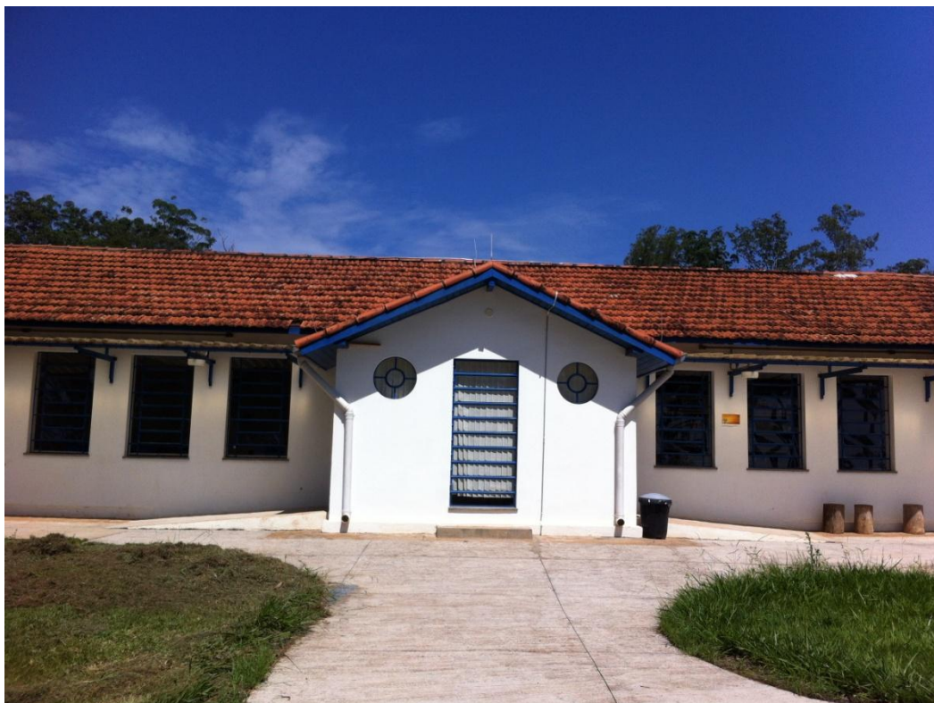
Figura 1 – Entrada da Biblioteca Campus Lagoa do Sino

de área de trabalho. Segue abaixo as fotos da entrada da biblioteca, do acervo e da sala de estudos.